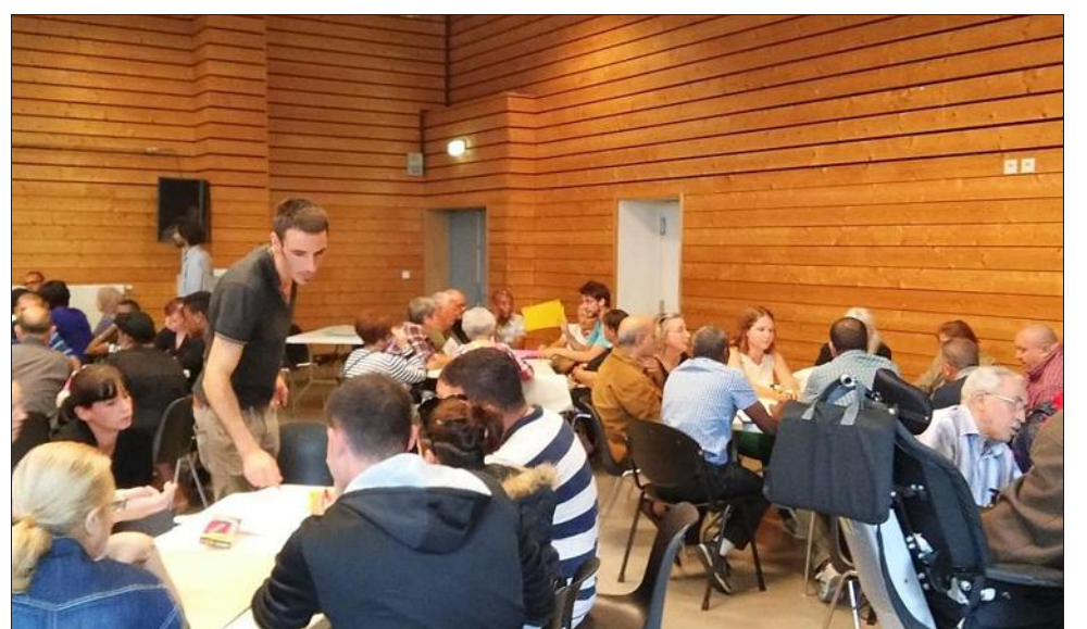
Lors de la réunion publique avec des habitants du quartier Teisseire, organisée par l'association Alliance citoyenne.

ville avaient été incendiés avant même qu'ils aient pu être inaugurés. Au niveau des actions planifiées, un courrier destiné au maire est déjà parti, et les habitants ont bon espoir de le rencontrer prochainement. Dans le cas contraire, le collectif a prévu de prendre des ballons et des enfants, pour aller jouer au foot devant la mairie de Grenoble. 3 Les bailleurs sociaux Actis et Grenoble Habitat Le sujet qui semble avoir cristallisé le plus de mécontentement est celui des bailleurs sociaux. Problèmes d'eau chaude, charges trop élevées et vagues, conditions d'hygiène ou entretien des bâtiments ont été mentionnés parmi les points urgents à régler. Les (nombreux) habitants présents ont également regretté la difficulté d'obtenir des experts et de pouvoir dialoguer avec les bailleurs sociaux, Actis comme Grenoble Habitat. Des courriers vont être envoyés dans les prochains jours, récapitulatif, parfois au cas par cas, les problèmes évoqués ci-dessus, et demandant une régularisation des charges jugées excessives. En cas de non-réponse, les habitants ont avancé la possibilité de faire une grève des loyers, en déposant l'argent sur un compte commun, ou en le versant à un huissier.