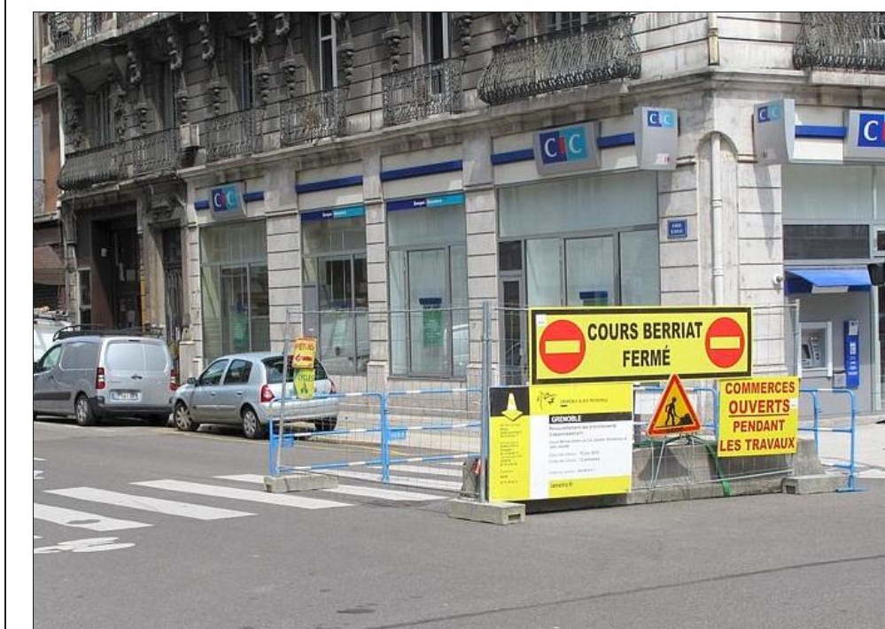
Les automobilistes vont devoir prendre leur mal en patience, le cours Berriat sera fermé à moitié pour douze semaines.